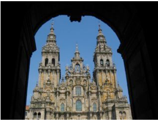
Catedral de Santiago de Compostela

The NSE testing began on March 1st and continued until April 15th. I received registration forms and payments from 18 high schools, which registered 1,258 students. There were initially some problems with the exam, which, after a few adjustments, seemed to have resolved themselves. I got a few complaints about the exam being online. It would be nice to get more schools participating next year. I think that we can do that by setting up testing centers around the state that have computer labs. Those schools that do not have computer labs could bring their students to the testing center and test them there. This is something that I hope to accomplish for next year. The test scores were available online on April 16th. Please let me know if you have any additional questions.