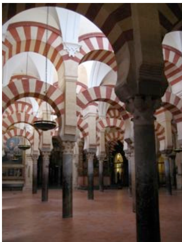
Mezquita, Córdoba