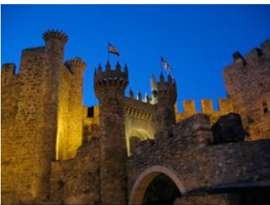
Castillo de Ponferrada, Castilla y León

No es lo mismo (Alejandro Sanz, 2005)-Mejor canción, Mejor álbum, Mejor intérprete, Grammys Latinos 2005