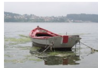
Combarro, Galicia